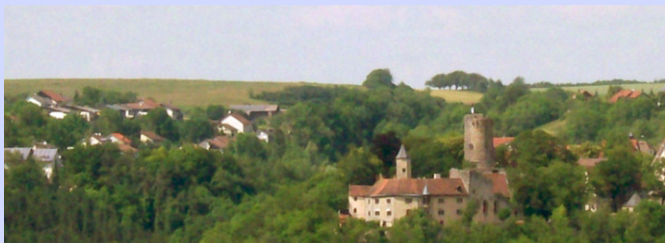
Krautheimer Burg, wo der berühmte Götz seinen Ausspruch tat