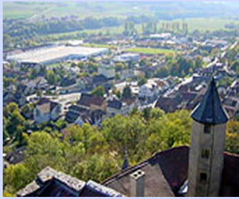
Blick über Krautheim

Krautheim ist ein kleiner ruhiger Ort mit rund 2.500 Einwohnern, idyllisch an der Jagst gelegen und zentraler Ausgangspunkt für Ausflüge in die wunderschöne Natur des Hohenloher Landes.