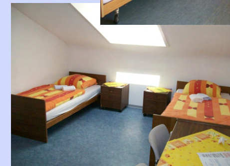
Einblick in einige unserer Gästezimmer